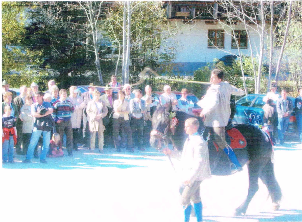
Fest und Hochzeitsschnalzen